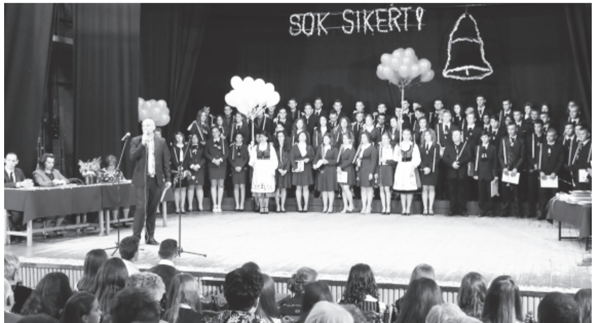
A fiatalok élete utélagáshoz ért, döntéseket kell felvállalniuk

Az ünnepség zárópillanataiban a művelődési ház előtti téren a zuhogó esőben a végzősök énekereztek többszínű léggömbjeiket: a piros a szeretetet, a fehér a tisztaságot, a kék a bölcsességet jelképezi.