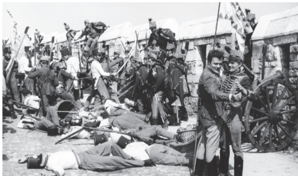
Jelenet a kőszívű ember fiai című filmből

Pünkösdi színes szöttek címmel a Kossuth rádió Rádiószínháza igényes irodalmi és zenei összeállítással kedveskedik irodalom-