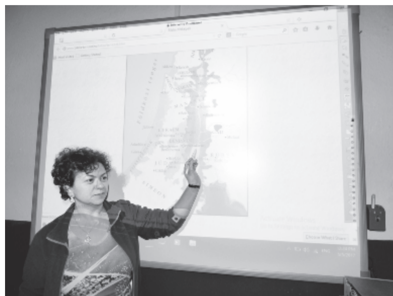
A gálfalvi diákok az üvegtáblát egy érdekesebbre cserélhetik

Az intézményvezető elmondta: azért vásárolták meg ezt az eszközt az adományból, mert saját költségvetésükből nem tehetnék volna meg, a segítségével érdekesebbek a tanórák, a diákok élvezik, könnyebben sajátíthatják el az információkat. Minden osztálynak bármikor hozzáférése van az új eszközhöz. Azt is hozzátette: az iskolának szüksége volna új számítógépekre, mert a meglévők régiiek, és az osztályokban nincsenek számítógépek, holott az új tankönyvekhez szükség volna ezekre az eszközökre is.